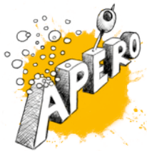
Apéro und Vorspeisen