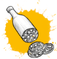
zu Wurst und Trockenfleisch