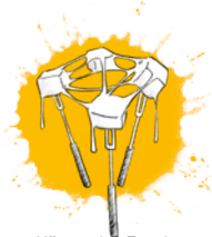
zu Käse oder Fondue