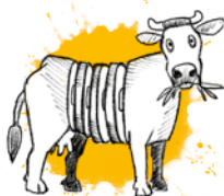
zu Fleisch und Gegrilltem